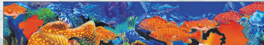
KOMUNITI IKEN MENESIM NA LUKAUTIM OL HAP WE OL PIS ISAVE BUNG LONG KARIM KIAU KLOSTU LONG PELES BLONG OL. OL IKEN PASIM NA TAMBUIM OL MANMERI LONG KISIM PIS TAIM OL PIS I BUNG LONG KARIM.